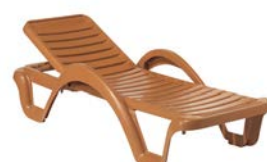
CARMEN T PRESTIGE