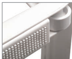
Ruedas opcionales Optional wheels