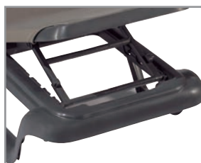
5 posiciones 5 positions

Auto-tensed system using the Balliu elastic cord that facilitates the fabric recovery.