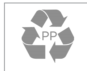
Resina 100% reciclable 100% recyclable resin