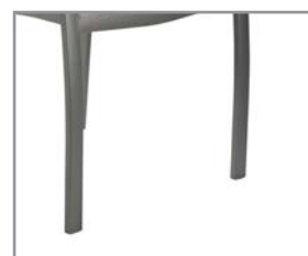
Pies protegidos Protected feet