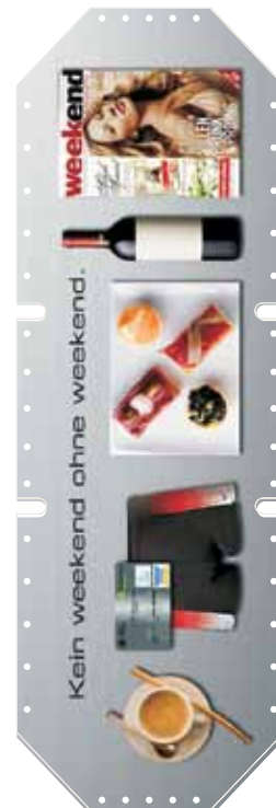
Beispiel 01 / 04