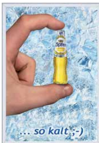
Beispiel 02 / 02