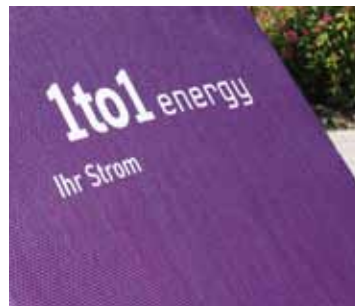
03 Wetterfestes Textil