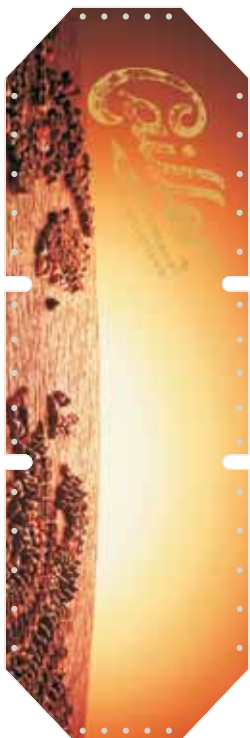
Beispiel 01 / 01