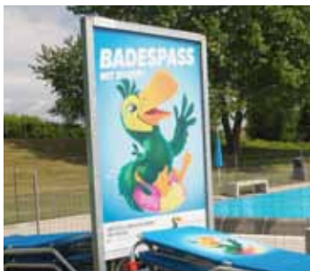
01 Werbefläche F4