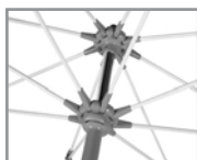
Varillas de fibra de vidrio Fiberglass rods