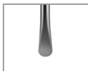
Acabado Media Luna Semicircle end