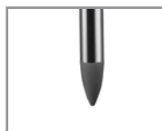
Punta poliamida Polyamide end