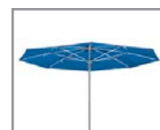
Sin faldón With straight end