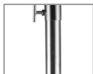
Pincho con manecilla de regulación Height adjustment handle

Sun umbrella features a height-adjustable stainless steel pole.