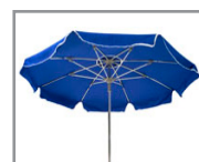
Con faldón With folded end