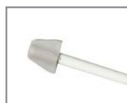
Protector P.P P.P end caps